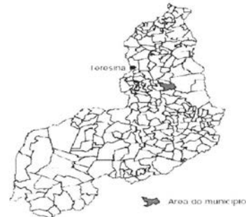
Figura 1 - Mapa de localização do município de Santa Cruz dos Milagres.

Piauí e Elesbão, a oeste com São Feliz do Piauí e, a leste, com Aroazes e São Miguel do Tapuio.