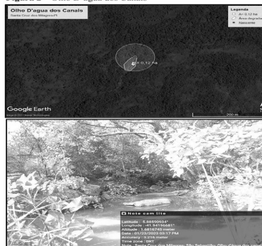
Figura 2 – Olho D'água dos Canais

Nascente 2 – Olho D'água dos Canais, fica localizada na zona rural do município e se encontra na seguinte coordenada 5°53'9.27"S, 41°56'31.08"O, foi observada áreas modificadas de pastagens próximo a nascente, apresenta potencial para a regeneração natural, desde que algumas medidas sejam tomadas, como limpeza, isolamento e plantio de mudas na região noroeste da nascente, onde se encontra com ausência de vegetação nativa.